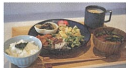
TEMPLE LOUNGE 「keshiki」